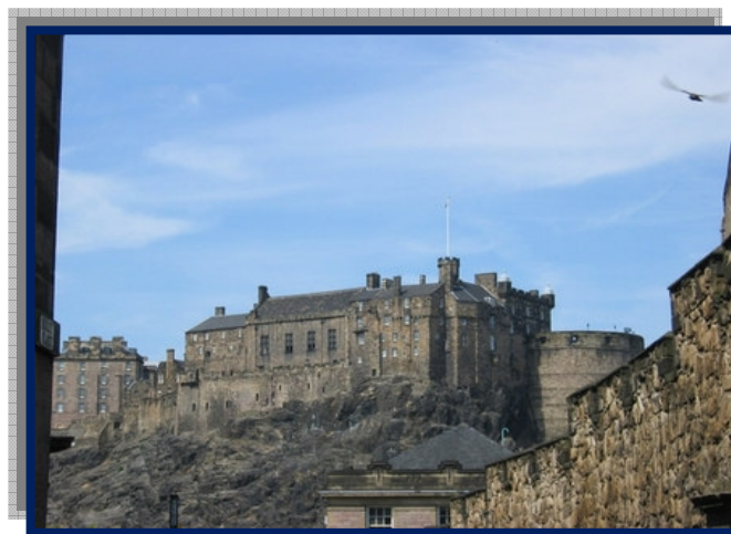
Castello di Edimburgo

Arrivo Aeroporto, ritiro veicolo. Avvio verso Edimburgo per check in Hotel/B&B. Serata e pernottamento a Edimburgo.