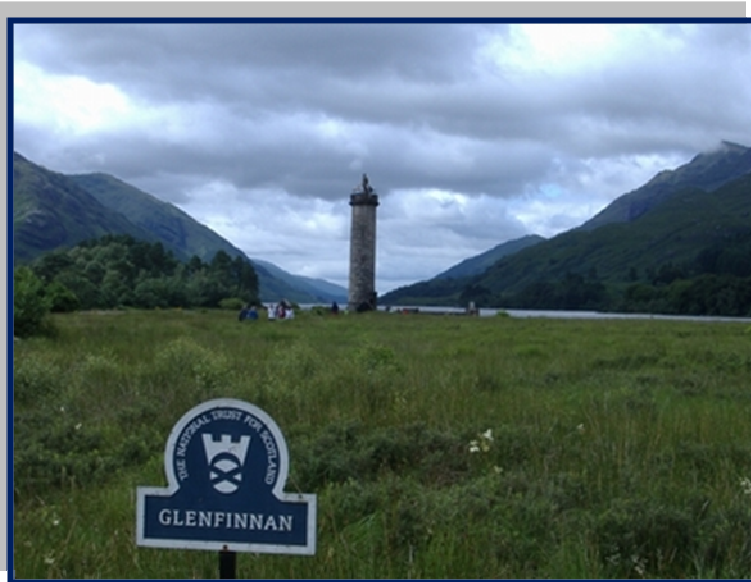
Glenfinnan, Road to the Isles

(Distanze: Inverness – Fort William km 104.3, 1 ora 26 min)